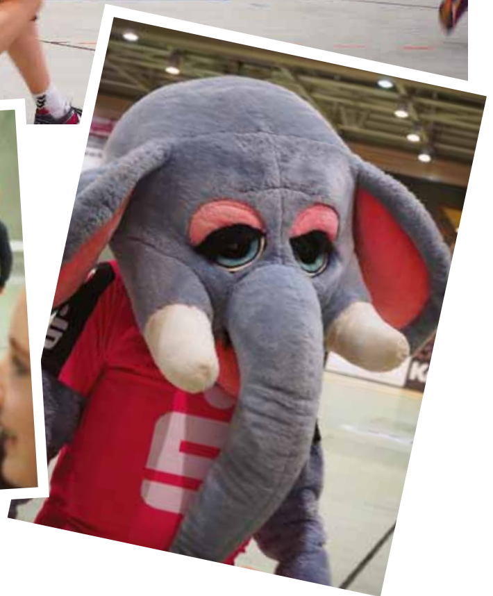
Autogrammstunde mit der Handballerin des Jahres; Anna Loerper.