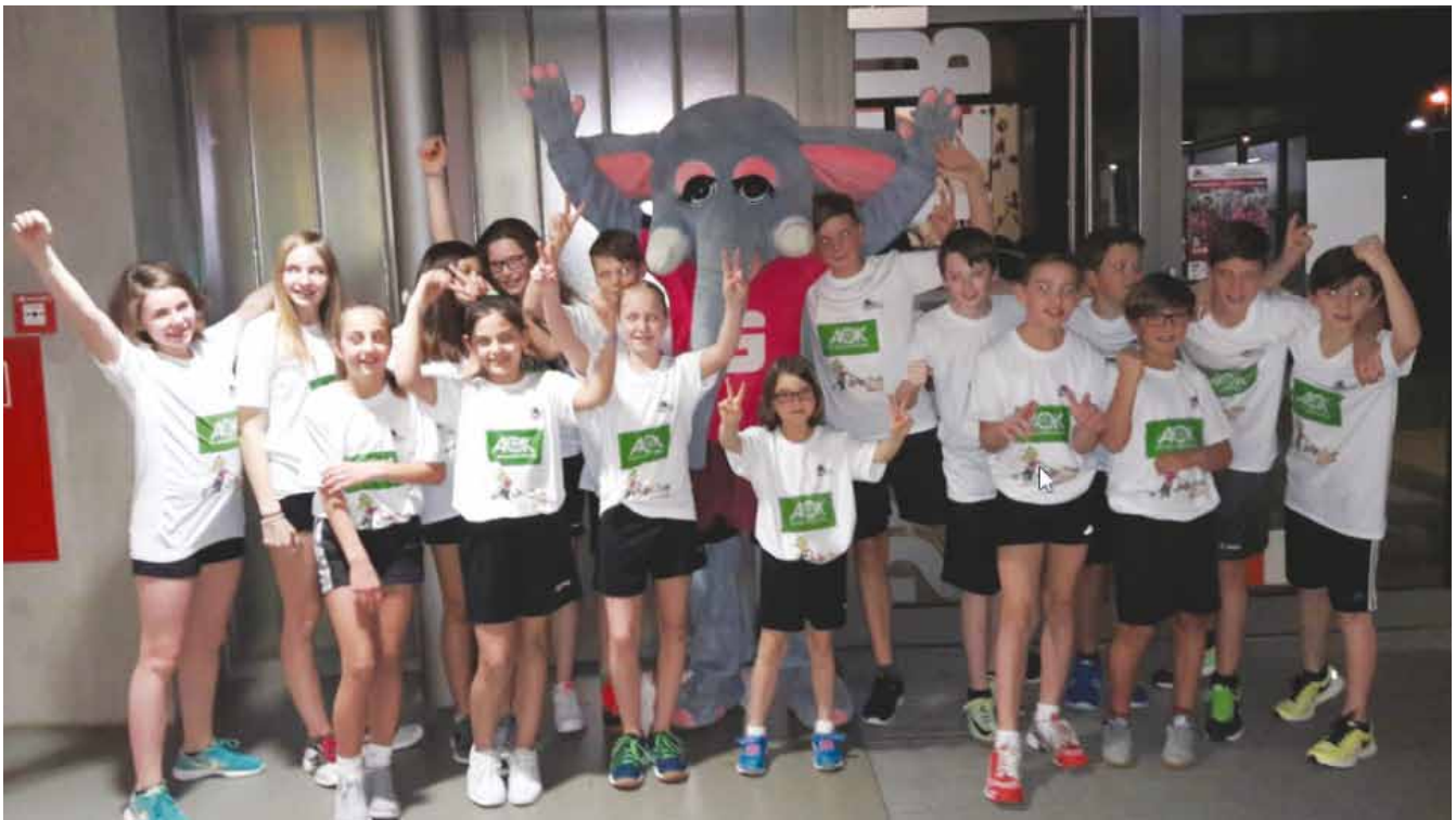
Die Handballer der TSG Münsingen mit dem Maskottchen „Tussiefant“ kurz vor dem Einlaufen.

Egal ob Spielerinnen oder Spieler, Trainer oder Eltern, die Münsinger waren fasziniert von der beeindruckenden Darbietung der Bundesligistinnen, die Handball auf höchstem technischem Niveau darboten. Nach der Partie umzingelten die handballbegeisterten Youngsters nicht nur die erst kürzlich gewählte Handballerin des Jahres, Anna Loerper, auch von allen anderen noch anwesenden Tussies wurden Autogramme und gemeinsame Selfies gesammelt.